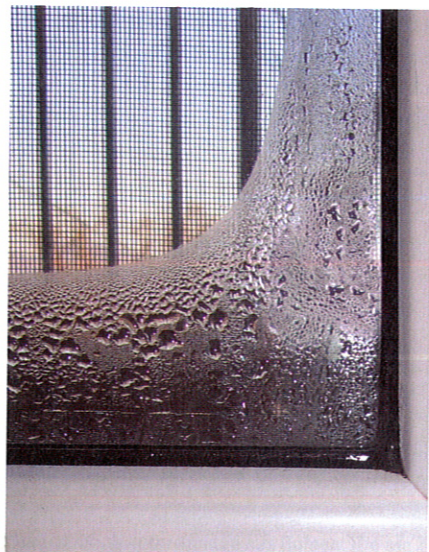
Ohne die T-Stripe Fensterheizung laufen viele Scheiben im Winter an.

Infos unter www.t-stripe.com oder telefonisch unter 0664 871 00 04