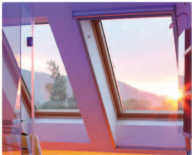
... an Dachflächenfenstern