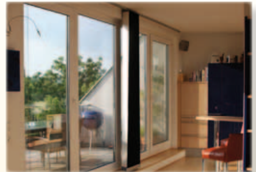
Ob aus Holz, Kunststoff oder Alu, T-STRIPE kann bei allen Fenstern montiert werden.

Bei vielen modernen Häusern werden Ganzglasecken eingebaut, da diese an Hausecken eine uneingeschränkte Aussicht ohne Fensterrahmen ermöglichen. Werden die Fenster neu eingebaut, dann kann das Heizelement direkt in der Silikonfuge versteckt montiert werden, sodass dieses nicht sichtbar ist. Bei bestehenden Fenstern wird T-STRIPE auf beiden Glasscheiben am äußersten Rand verlegt. Im Eck/Am Stoß verläuft in der Folge je ein Heizelement auf je einer Fensterscheibe. Durch diese verstärkte Heizleistung wird Kondenswasser verlässlich verhindert.