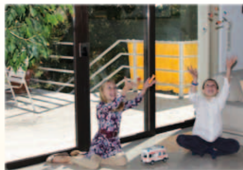
Mit T-STRIPE wird zusätzliche Wärme an den Wohnraum abgegeben.

T-STRIPE ist ein bewährtes System, das bereits tausende Fenster in Einfamilienhäusern, Wohnbauten und Bürogebäuden trocken hält. Besonders geschätzt wird das Fensterheizsystem für Wohnraumfenster, Dachflächenfenster, Wintergärten und große Glasverbauten, da dort häufig Kondenswasser auftritt.