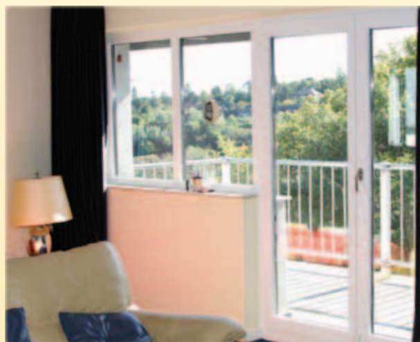
... bei raumhohen Fenstern