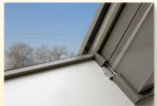
T-STRIPE Design-Aluleiste in dunkelgrau pulverbeschichtet