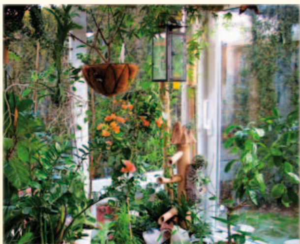
... in Wintergärten