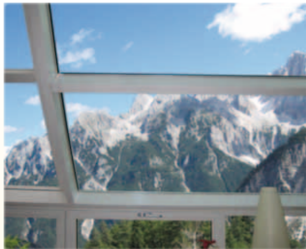
... an Fixverglasungen