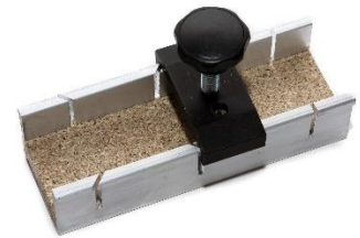
Abb. 1: Schneidelehre

Wichtig: Für die Montage muss die Fensterscheibe mindestens 20°C warm sein (diese Temperatur ist für die Verarbeitung des Spezialklebebandes vorgeschrieben)! Sie können die Scheibe daher im Winter mit einem Heizstrahler oder ähnlichem vorher ganzflächig erwärmen.