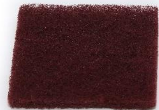
Abb. 3: Schleifpad