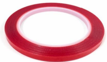
Abb. 4: beidseitiges Klebeband